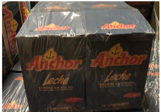
La protección resistente y segura es posible con el uso de PE de alto desempeño de ExxonMobil en película termoencogible con material reciclado.