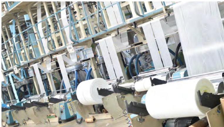
Rollos de película termoencogible con contenido PCR del 25% producidas en la planta Ternova.